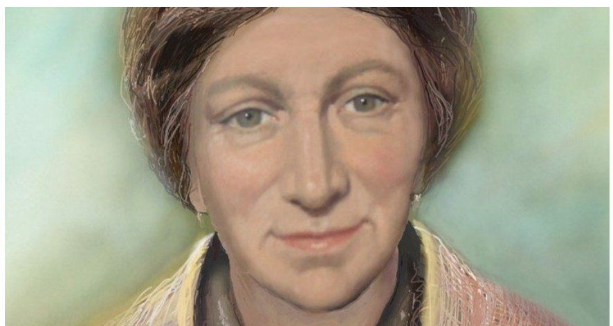
Marie Madeleine d'Houët, Gründerin der Treuen Gefährtinnen Jesu

Marie Madeleine ist eine „Freundin“, die über uns wacht, für unsere Bedürfnisse eintritt und uns als Vorbild inspiriert. Wenn du Hilfe bei etwas brauchst, bitte sie, mit dir zu beten.